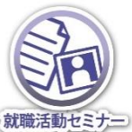
就職活動セミナー

職業適性診断テストを利用し、客観的な自己分析を図ることで、就活の質はグッと変わります。 各種講座を活用し、就活力を高めてみませんか。